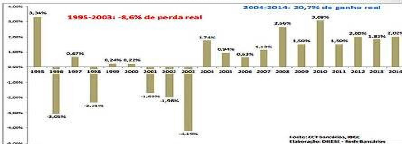
Bancos Privados – Ganhos Reais