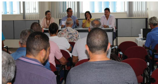
Federação dos Bancários da Bahia e Sergipe

No eixo específico, prevê a participação da Feebbase nas reuniões e eventos dos sindicatos; a realização de grandes atividades com a participação da categoria; investimento na formação dos dirigentes; a defesa da saúde e melhores condições de trabalho para os bancários; o fortalecimento da comunicação e a construção, juntamente com o Comando dos Bancários, da campanha nacional.