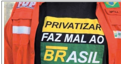
Para TST, greves contra privatização das estatais são abusivas. Intimidação

O brasileiro está perdendo tudo. Até o direito legítimo de se manifestar. O pior é que a determinação vem do Judiciário. O TST (Tribunal Superior do Trabalho) decidiu que as greves contra privatização das estatais são abusivas.